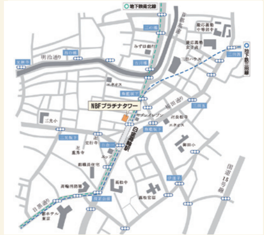
※会場は変更になる場合がございます。その際は、受講者に別途ご連絡いたします。

下記申込欄に必要事項をご記入の上、FAXでお送りください。後日、受講券と請求書をお送りします。 ※受講料は開催日(受講開始)前日までにお振り込みください。お申し込み後のキャンセル、ご送金後の返金はお受けいたしかねます。代理の方が出席くださいますようお願いいたします。 ※主催者、講師等の諸般の事情により、また最少開催人員(15名)に達しない場合、開催を中止させていただく場合があります。予めご了承ください。 ※下記にご記入いただいた情報が不明な箇所があった場合等、確認のためにe-mail/電話等での連絡をさせていただく場合がございます。 ※本講座は自社のIT部門の能力強化をねらいとしています。講師企業と競合すると考えられる製品やサービスなどをご提供される会社の方や講座のねらいと異なる動機(営業目的、受講者情報や研修ノウハウの取得など)をお持ちの方は、受講開始前、受講開始後を問わず、主催者の判断に基づき受講をお断りさせていただく場合がございますので、あらかじめご了承ください。 ※会場までの交通費や宿泊費は、受講される方の負担となります。 ※講師の急病、天災その他の不可抗力、又はその他やむを得ない理由により、講座を中止する場合があります。この場合、未受講の講座の料金は返金いたします。また弊社からの受講お断りによる未受講分の料金も返金いたします。複数回連続して開催する講座の場合は、全体の開催回数の中で、中止および受講をお断りした講座の回数分を回数による均等割で返金します。