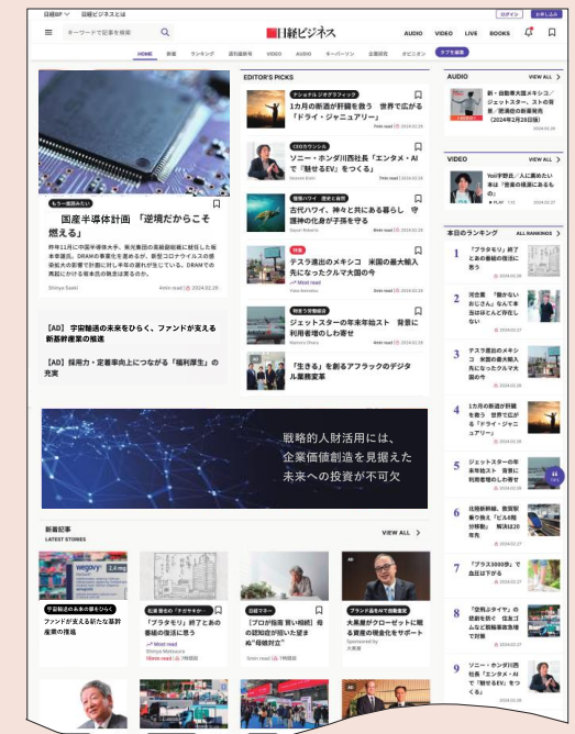
日経ビジネス電子版各種広告枠

※掲出場所は一例であり、メニューにより使用枠が異なります。すべての位置に掲載を保证するものではありません。 ※掲載位置は予告なく変更することがございます。あらかじめご了承ください。