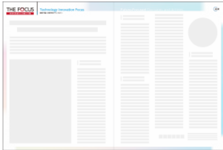
雑誌 – 記事体広告 2 ページ