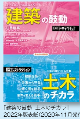
「建築の鼓動 土木のチカラ」 2022年版表紙(2020年11月発行)