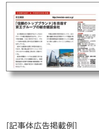
[記事体広告掲載例]