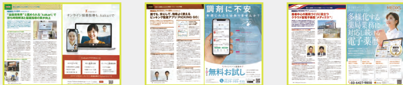
A社タイアップ記事

広告企画体裁見本 選ばれる薬局になるための製品・ソリューション特集(2020年掲載例)