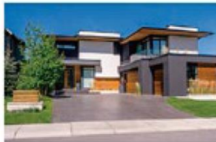
企業価値は様々な要素が複合化して決まる時代です。企業理念・経営ビジョン、事業戦略

企業価値は様々な要素が複合化して決まる時代です。企業理念・経営ビジョン、事業戦略、業績はもちろん環境、社会への貢献などが幅広いステークホルダーの評価を受け、その総合化されたものが企業価値と言えます。CSR(企業の社会的責任)が世界のスタンダードになろうとしている今、経営トップが自らの言葉で語る明確なメッセージが重要になっていきます。本企業は、経営トップがステークホルダーに対して、企業理念や経営ビジョン、IR情報を的確に伝える手段として、貴社のPR戦略の一助をなすものと願っております。どうぞご活用ください。企業価値は様々な要素が複合化して決まる時代です。企業理念・経営ビジョン、事業戦略、業績はもちろん環境、社会への貢献などが幅広いステークホルダーの評価を受け、その総合化されたものが企業価値と言えます。CSR(企業の社会的責任)が世界のスタンダードになろうとしている今、経営トップが自らの言葉で語る明確なメッセージが重要になってい