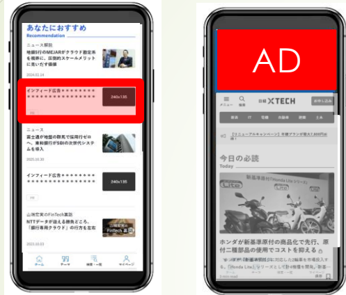
④スマホ・インフィード⑤スマホ・ヘッダーパネル (ITのみ)