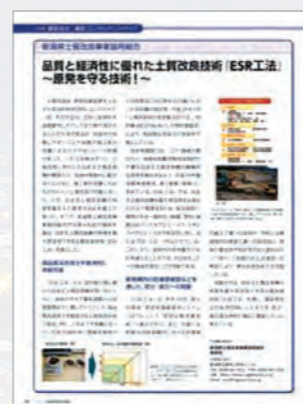
「建設会社・建設コンサルタントガイド」 広告掲載例