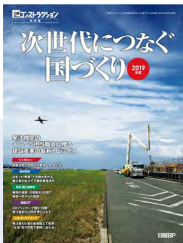
2019年度版の見本誌を ご用意しています