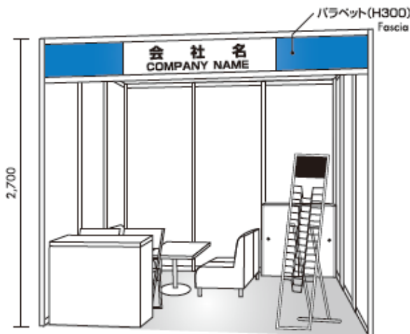
※イメージ図はAタイプです。

(消費税別) Consumption tax 10% will be added.