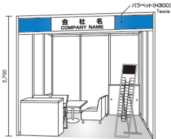
※イメージ図はAタイプです。

(消費税別) Consumption tax 10% will be added.